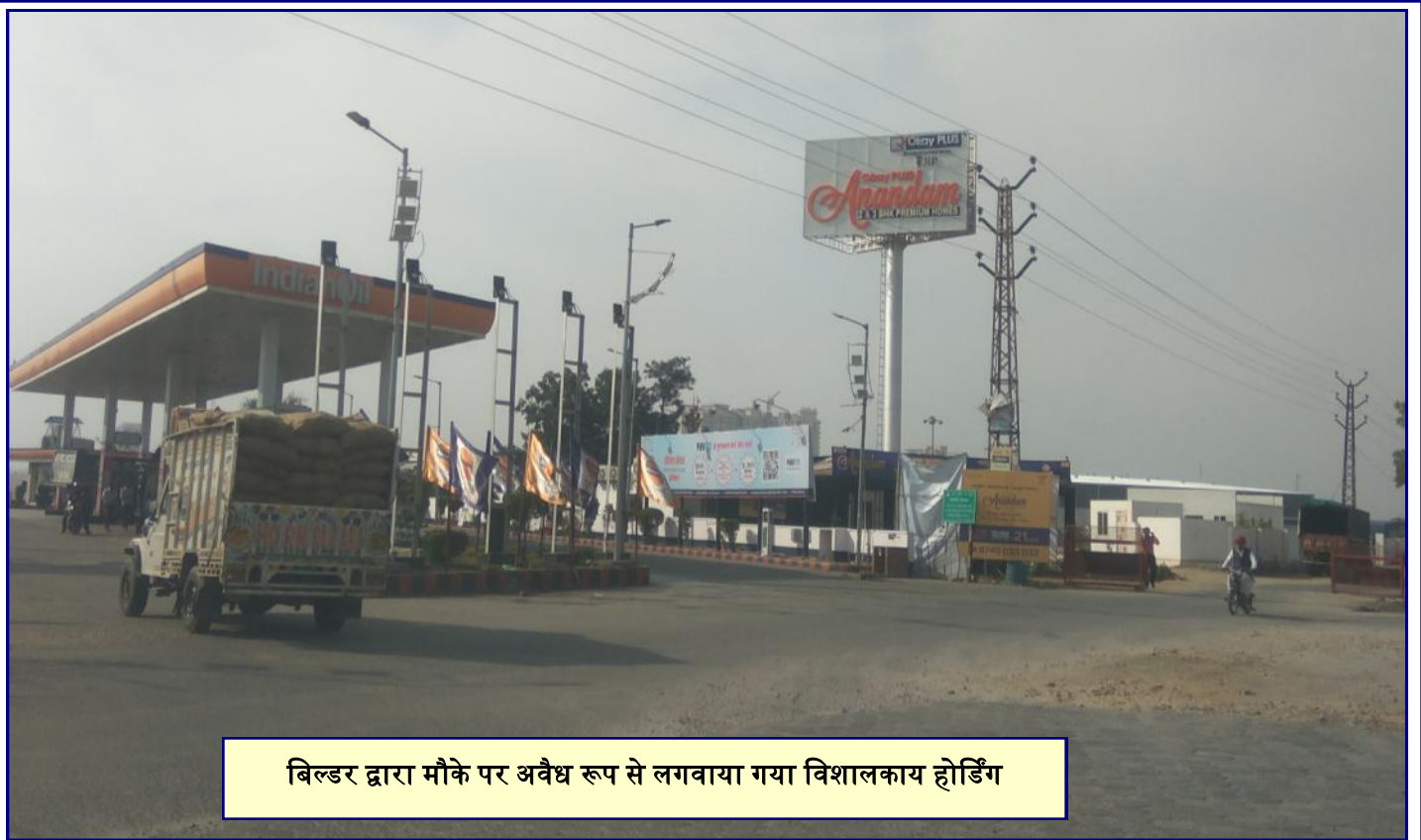
बिल्डर द्वारा मौके पर अवैध रूप से लगवाया गया विशालकाय होर्डिंग