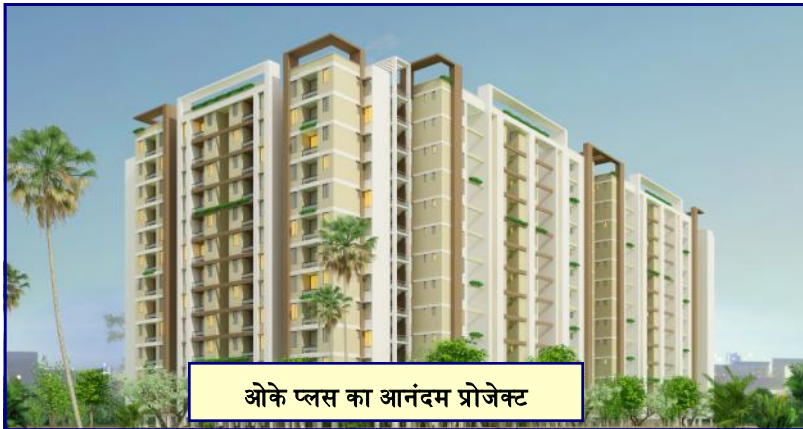
ओके प्लस का आनंदम प्रोजेक्ट